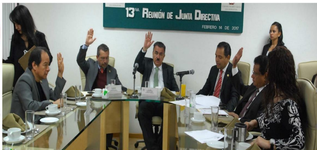
Treceava Reunión 14 de Febrero 2017