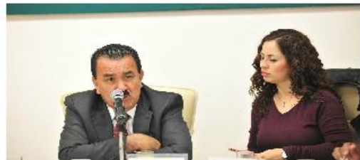
Decima Reunión 8 de Octubre 2016