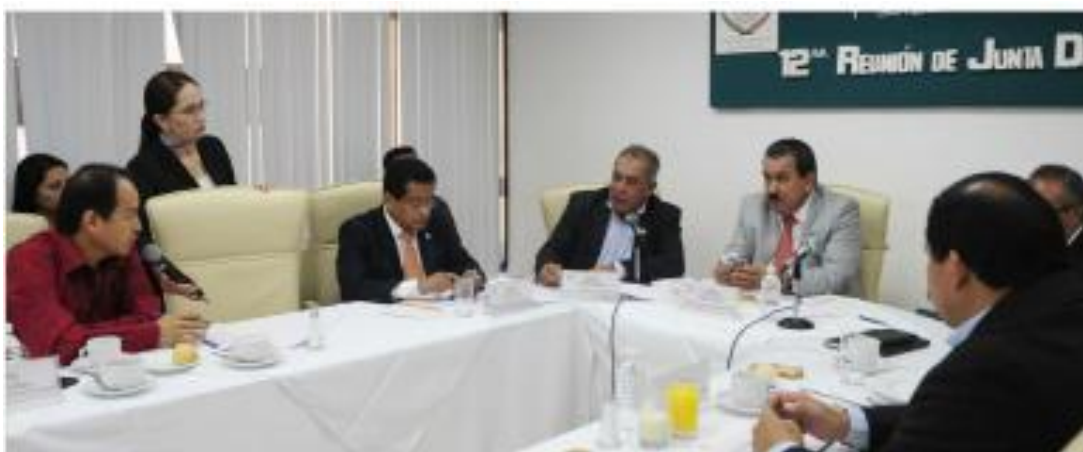
Doceava Reunión 31 de Enero 2017