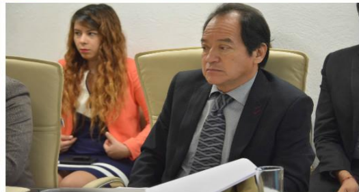
Novena Reunión 18 de Octubre 2016