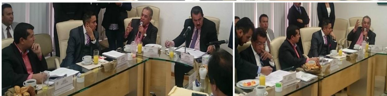
Onceava Reunión 7 de Diciembre 2016