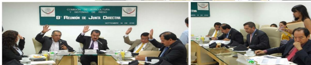
Octava Reunión 14 de Septiembre 2016